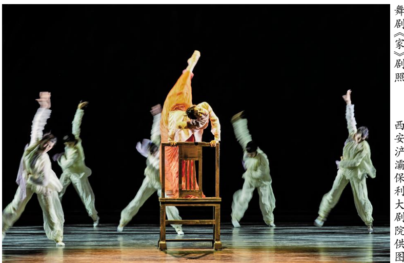
舞剧《家》剧照

文化艺术报(全媒体记者张惠妹)7月8日,国家艺术基金2025年度传播交流推广资助项目、四川艺术基金2025年度重点资助项目舞剧《家》在西安浐灞保利大剧院上演。