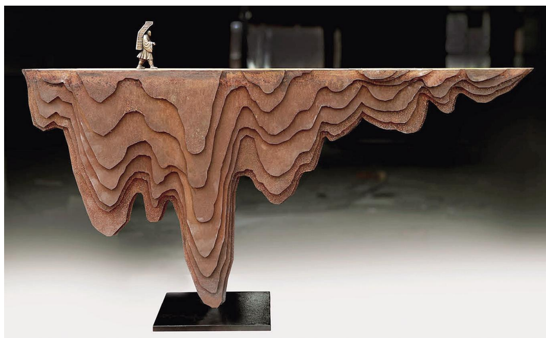
《寻道·大漠》(雕塑) 马辉