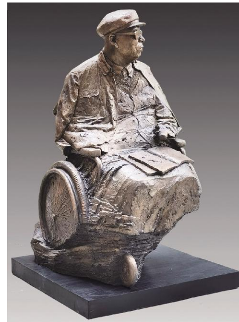
《群众的领头人朱彦夫》(雕塑) 马辉