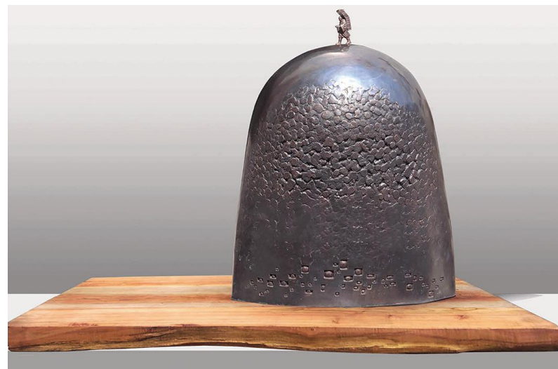
《寻道·高峰》(雕塑) 马辉