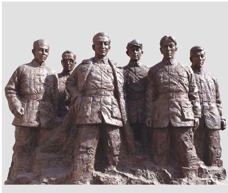
《照金风云》(雕塑) 马辉