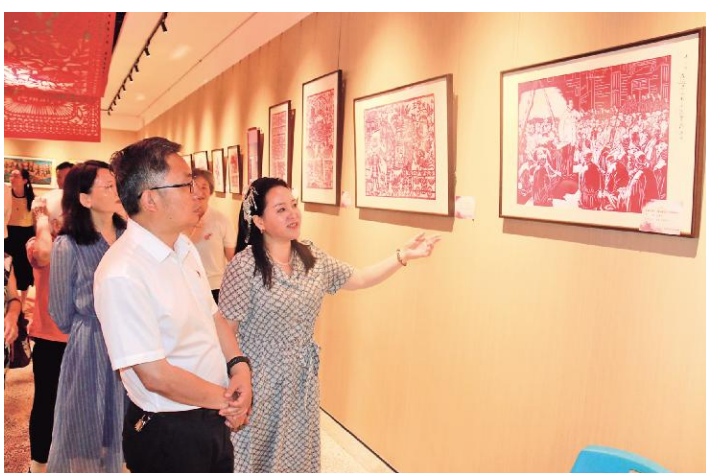
党员干部参观专题展