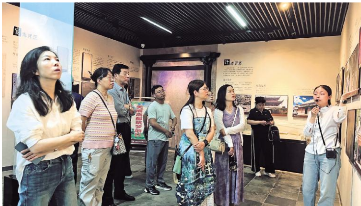
两地采风作家在江苏高邮文游台参观