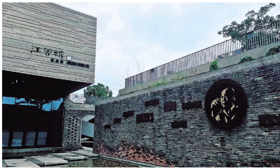
江苏高邮汪曾祺纪念馆外观