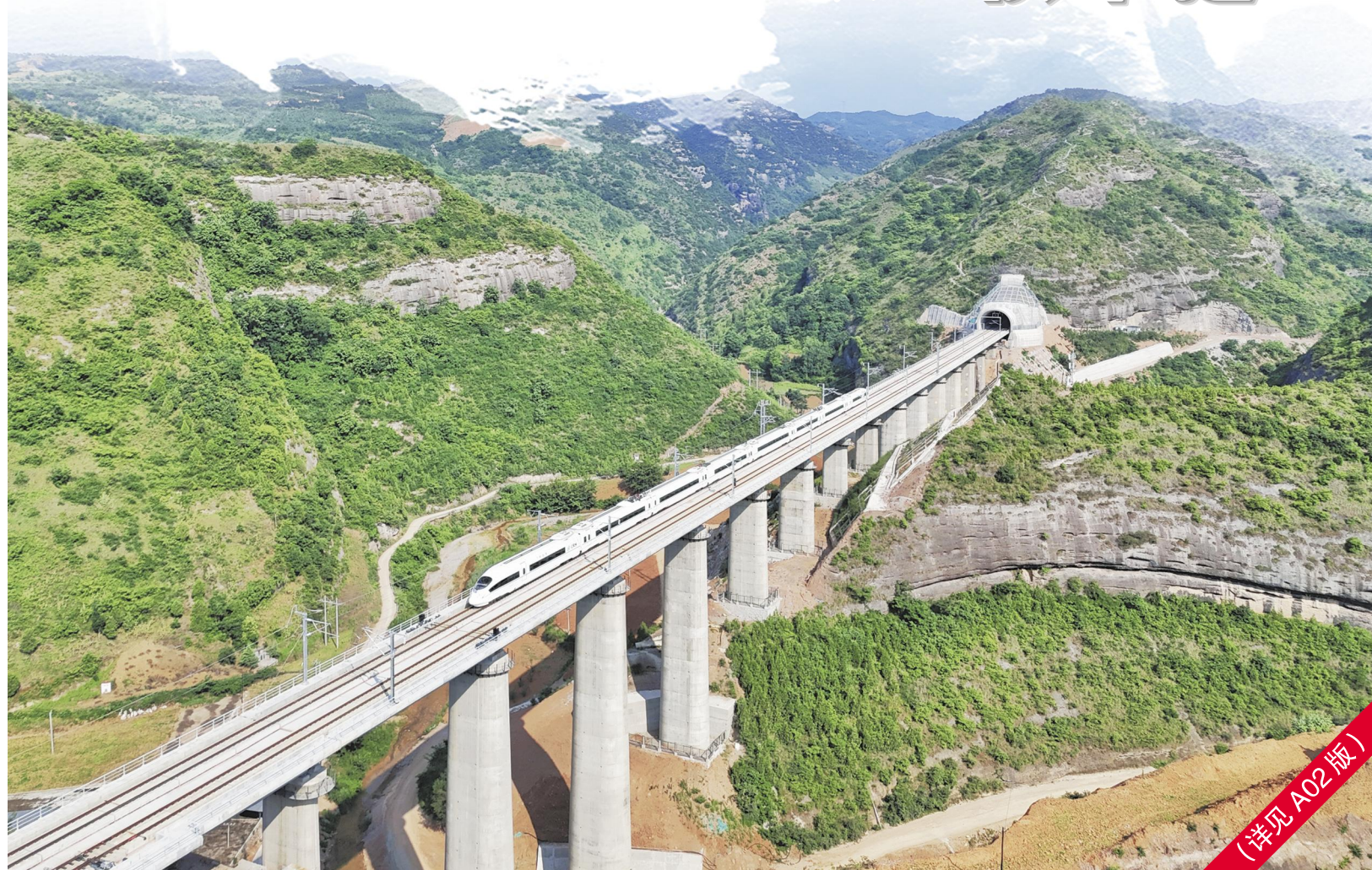
6 月 16 日,西十高铁启动全线拉通试运行,试验动车组在线路上飞驰