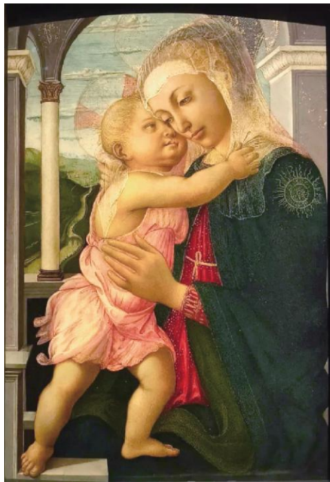
波提切利《圣母子像》1467年 乌菲齐美术馆藏 木板蛋彩