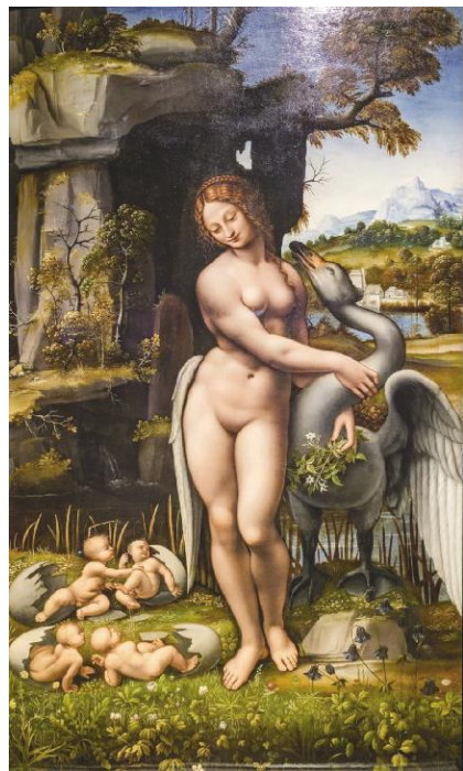
梅尔齐《勒达与天鹅》1516年 乌菲齐美术馆藏 木板油画