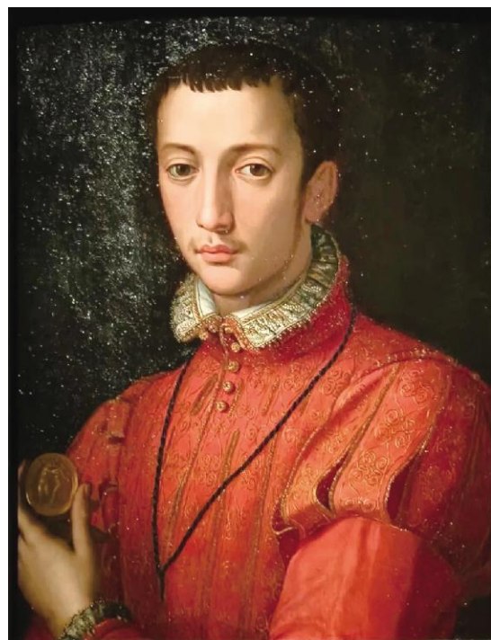
亚历桑德罗·阿洛里《弗朗切斯科一世·德美第奇肖像》1555年 乌菲齐美术馆藏 木板油画