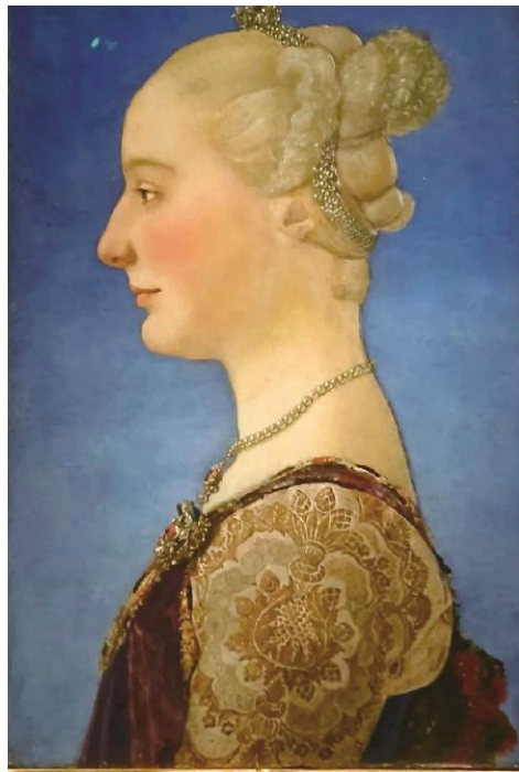
皮耶罗·德拉·波拉约洛《青年女子肖像》1475年 乌菲齐美术馆藏 木板蛋彩与油画

本次展览在中国美术馆一层第3、5、7号展厅展出,每周一闭馆,将展至8月28日,观众可通过中国美术馆官方小程序等线上平台提前购票、预约参观。