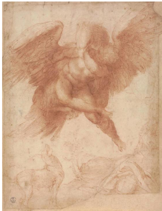
米开朗基罗《劫掠伽倪墨得斯》1530年 乌菲齐美术馆藏 纸本粉笔