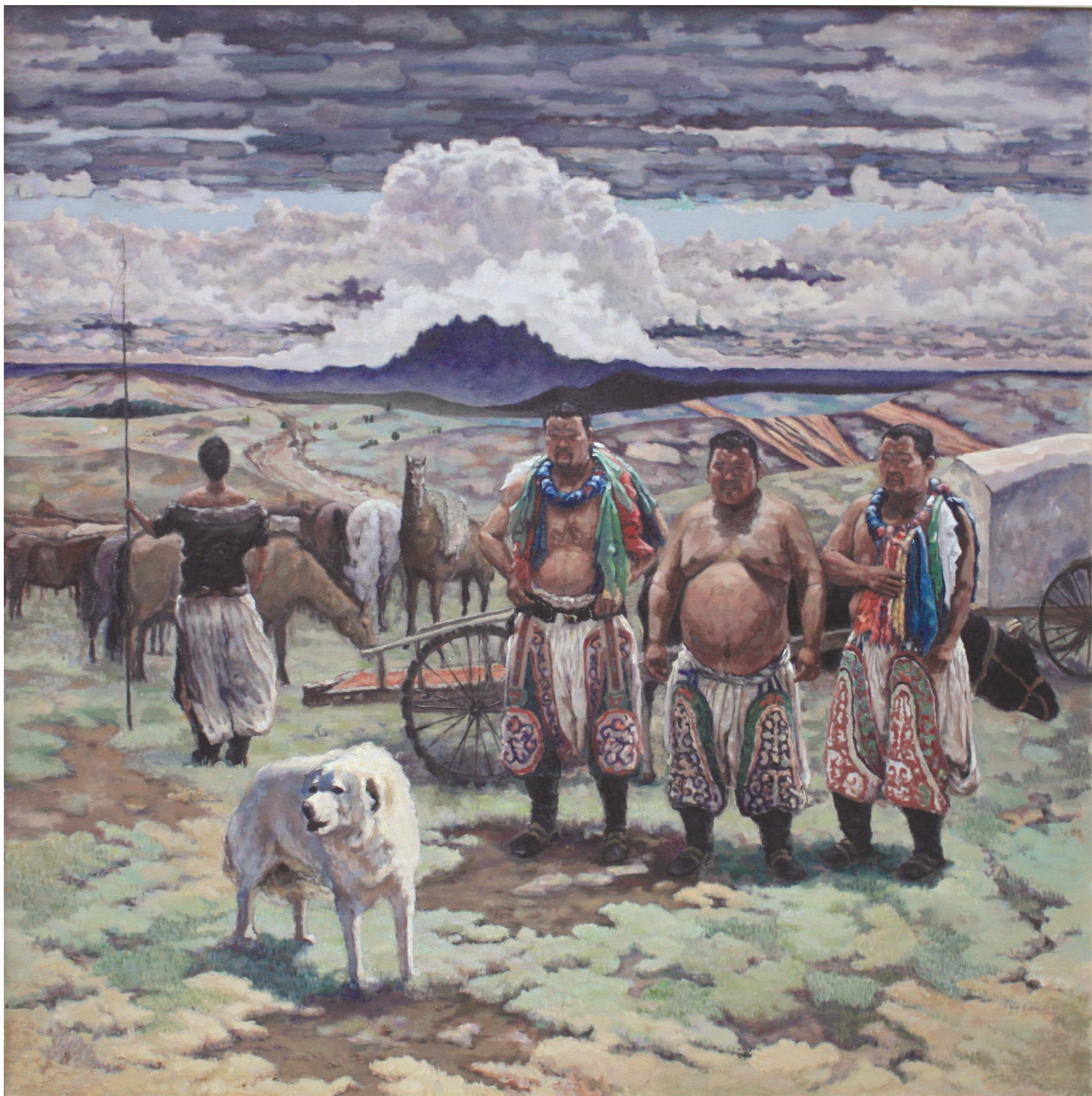
李宁《天边的云系列二》布面油画 180cm×180cm 2014年

2014年《刘家山》入选“陕西省第七届艺术节优秀美术作品展”,《天边的云系列三》入选“第一届南京国际美术展”,《天边的云系列二》入选“陕西省庆祝中华人民共和国成立65周年美术作品展”。