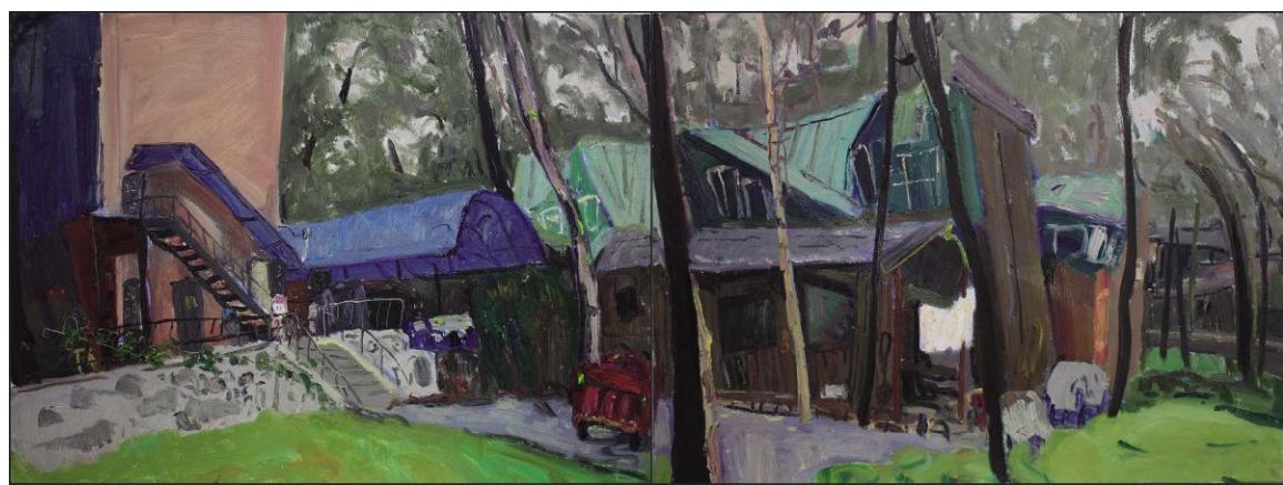
李宁《乡村艺术馆后景》布面油画 60cm×160cm 2022年