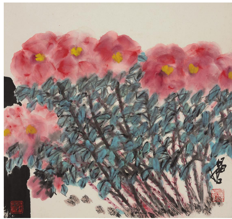
樊昌哲《润雨》纸本设色 50cm×53cm 2025年