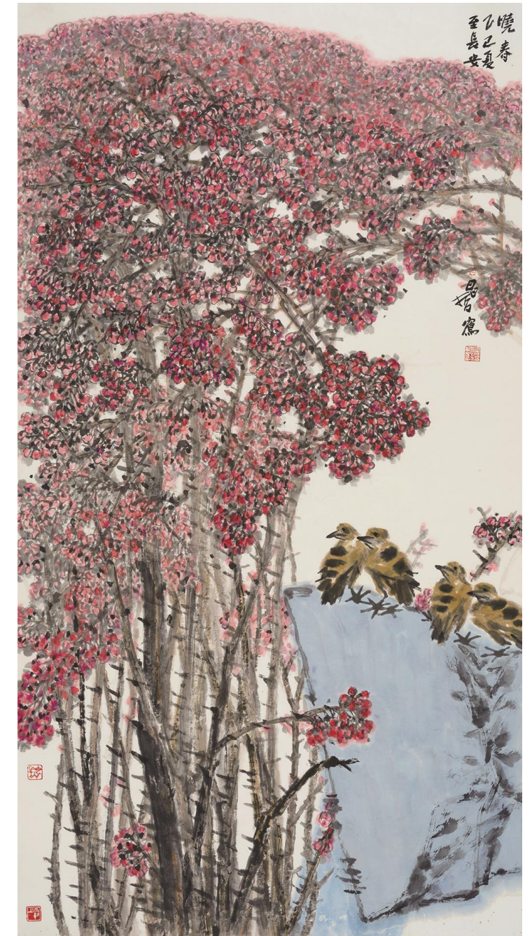
樊昌哲《晚春》纸本设色 179cm×97cm 2025年