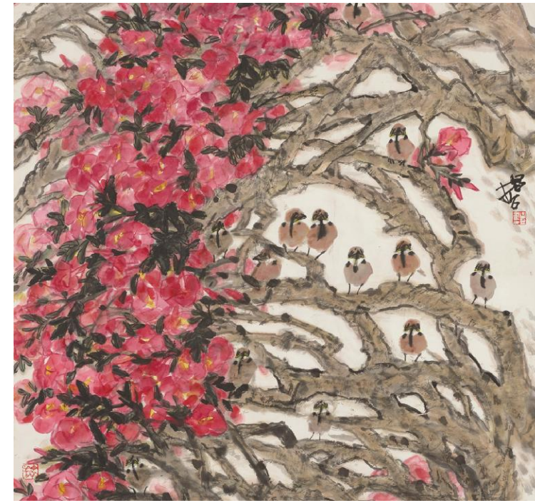
樊昌哲《版纳三月》纸本设色 92cm×98cm 2023年