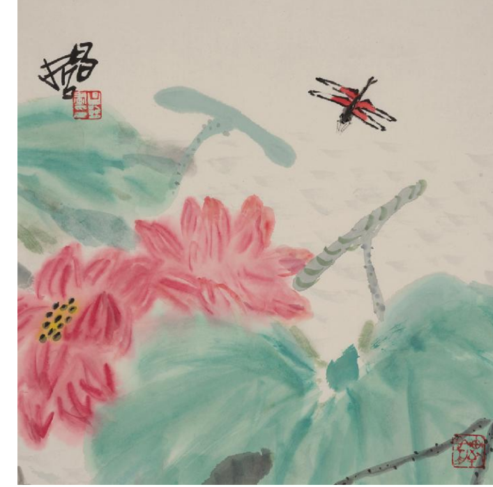
樊昌哲《不染》纸本设色 42cm×42cm 2024年