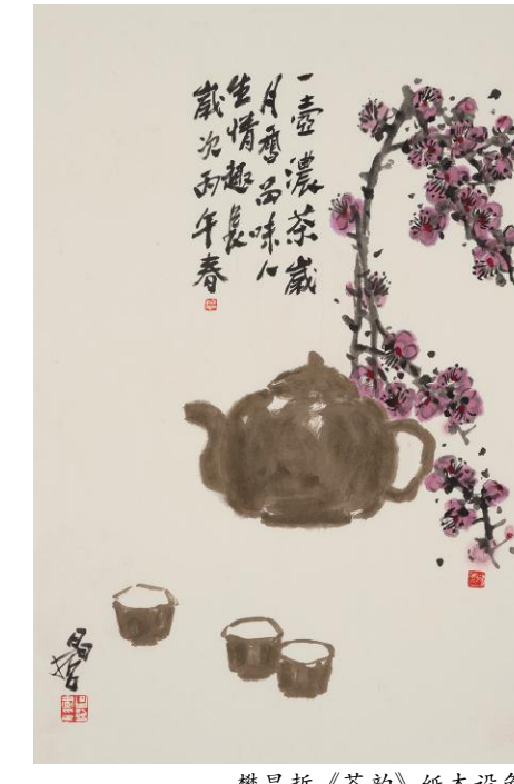
樊昌哲《茶韵》纸本设色 70cm×46cm 2026年