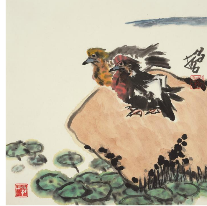
樊昌哲《鸳鸯》纸本设色 44cm×44cm 2024年