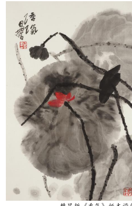
樊昌哲《香气》纸本设色 70cm×46cm 2025年