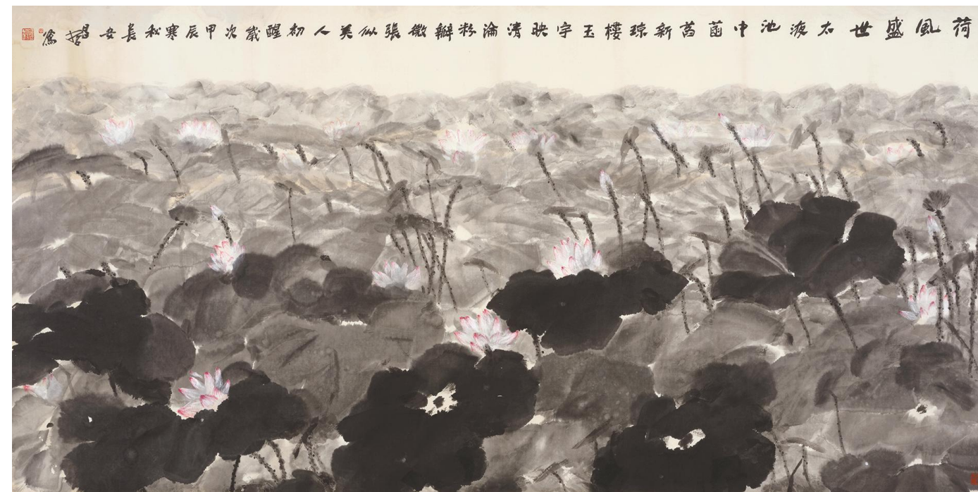
樊昌哲《荷风盛世》纸本设色 124cm×248cm 2024年