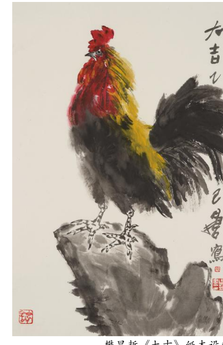
樊昌哲《大吉》纸本设色 70cm×46cm 2025年