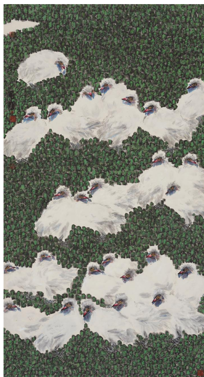
樊昌哲《瑞雪》纸本设色 197cm×97cm 2023年