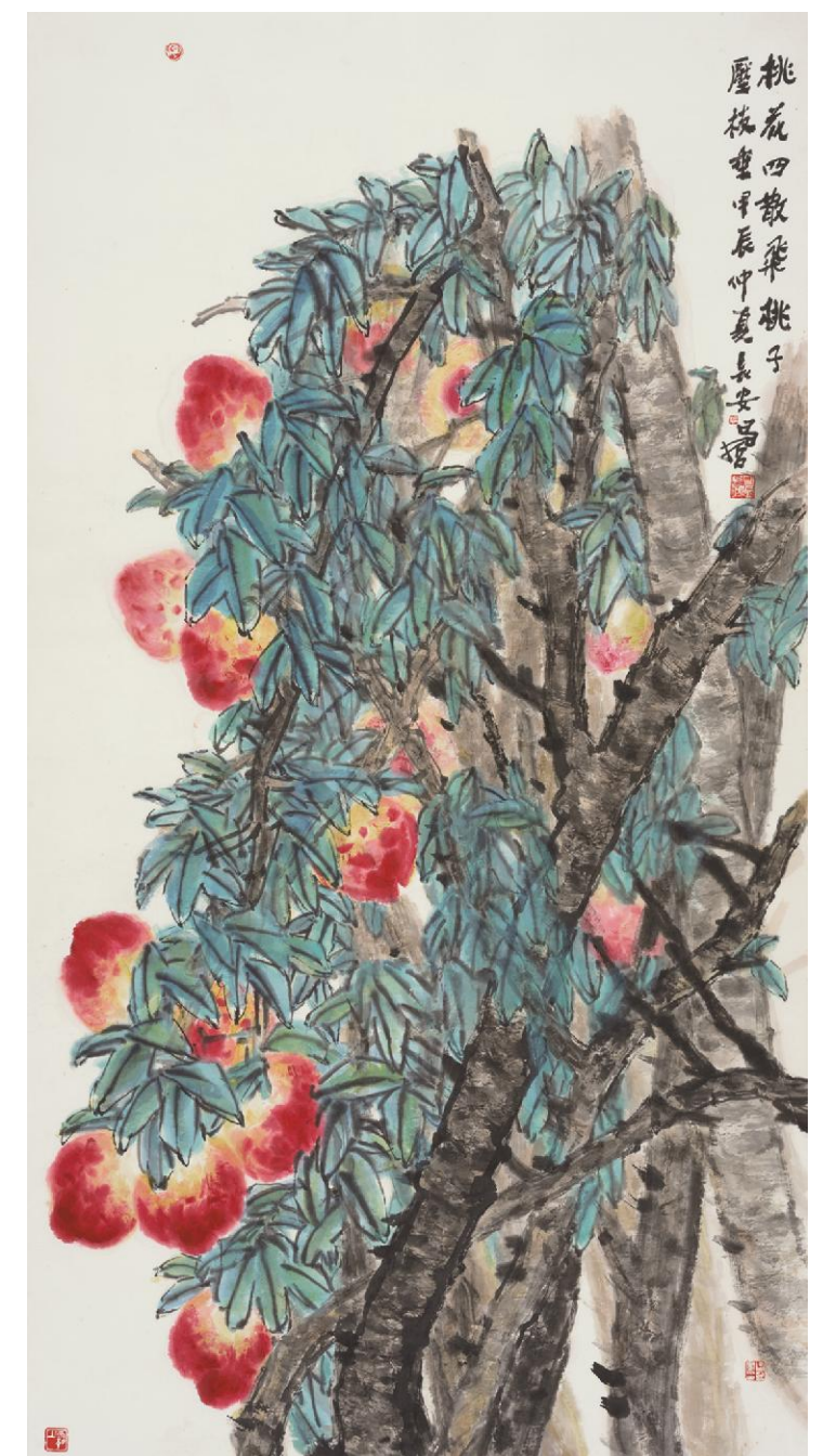
樊昌哲《鲜》纸本设色 179cm×97cm 2024年

这是一位画家如何在平凡的脚步踏实的努力中，开出绚丽的审美之花的故事。（作者系陕西省文联原副主席、著名文化学者、文艺评论家）