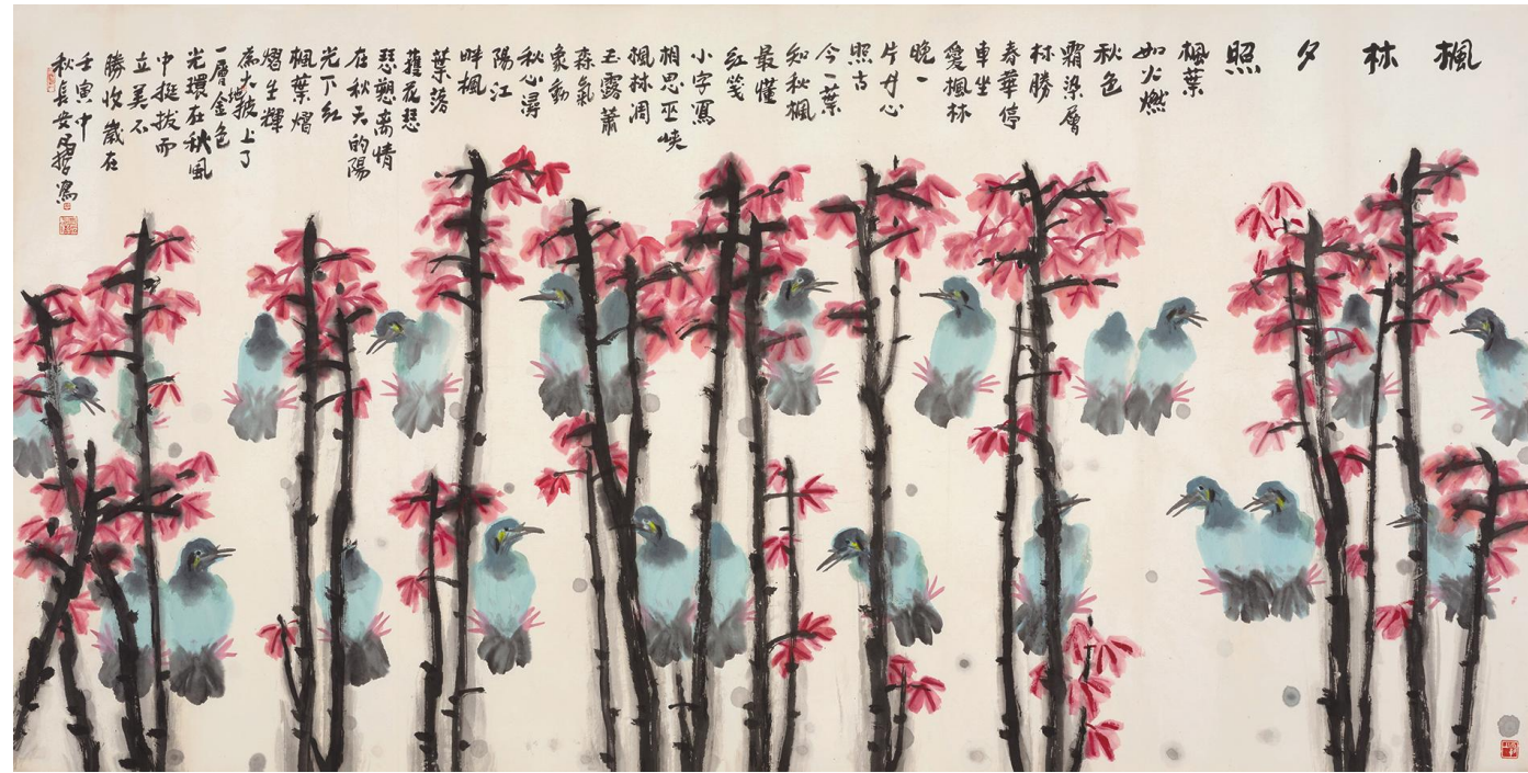
樊昌哲《枫林夕照》纸本设色 124cm×245cm 2022年