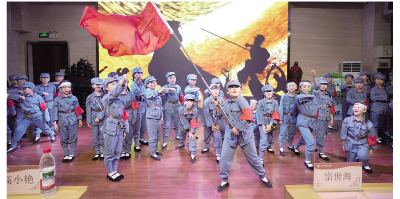
西安未央锦园小学三年级5班全体学生表演红色情景剧《长征》

文化艺术报(全媒体记者王转)恰逢陶行知先生135周年诞辰,6月3日,西安市陶行知教育研究会双语实践“阅读小先生”读书会在西安未央锦园小学举办。本次活动由西安市陶行知教育研究会主办、未央区教育局协办、锦园学校承办,以“传陶行知育人理念,做新时代阅读少年”为主题,会聚区域教育主管领导、教研专家、各会员单位校长、师生及家长代表等,共探阅读育人高质量发展新路径。