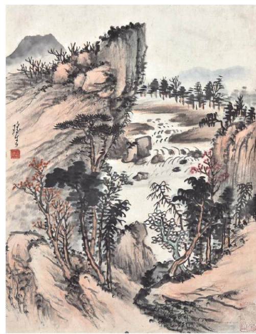
陈瑶生《课徒稿·山水范式之一》纸本设色 45.1cm x 33.5cm