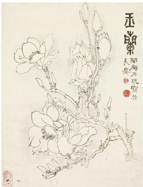
郑乃珩《玉兰》纸本水墨 42.7cm x 33cm 1958年