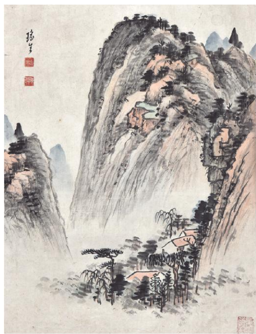
陈瑶生《课徒稿·山水范式之二》纸本设色 45.1cm x 33.5cm