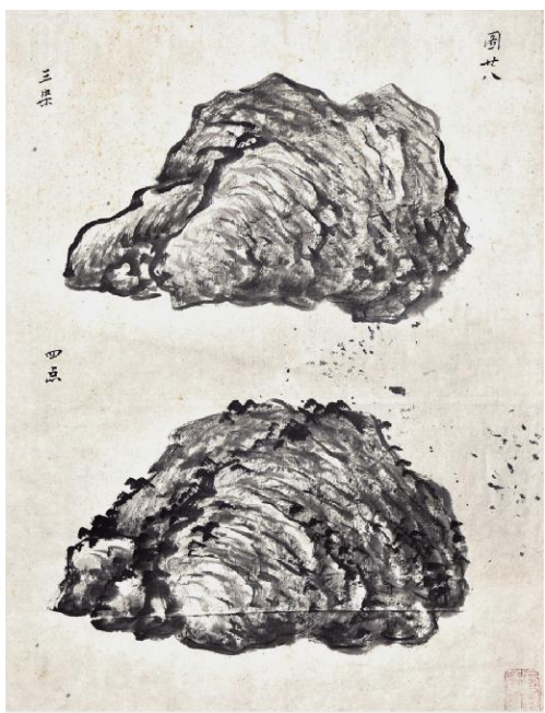
陈瑶生《课徒稿·石法示范》纸本水墨 45.1cm x 33.5cm