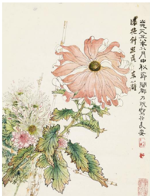
郑乃珩《浓艳斜照落东篱》纸本设色 42.7cm x 33cm 1958年