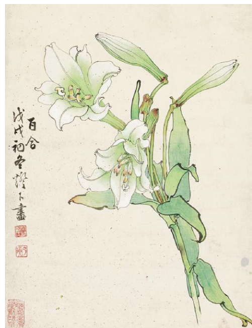
郑乃珩《百合》纸本设色 42.9cm x 33cm 1958年