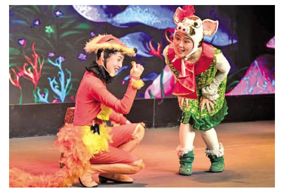
《三只小猪》剧照

经典童话故事《白雪公主》向小观众们传递善良、勇敢与真诚的美好品质；《三只小猪》则以轻松诙谐的表演风格和贴近生活的剧情设计，巧妙地引导孩子们认识到踏实肯干、智慧思考远比投机取巧更加可靠和珍贵；绘本剧《渔夫与金鱼》，在引人入胜的情节中启发孩子们深入思考“知足常乐”与“欲望无度”之间的界限；寓言新编《龟兔赛跑》则大胆突破传统单向说教的模式，融入互动参与机制，让小观众有机会直接介入剧情发展，共同决定比赛走向。在沉浸式体验中真切感受合作精神与坚持不懈的重要价值；国学互动剧《东郭先生与狼》巧妙