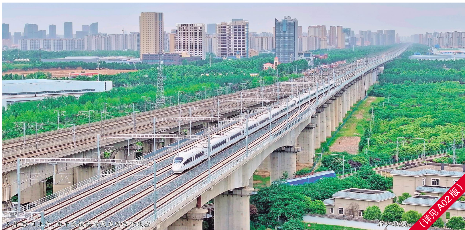
5月29日上午,西十高铁陕西段启动运行试验