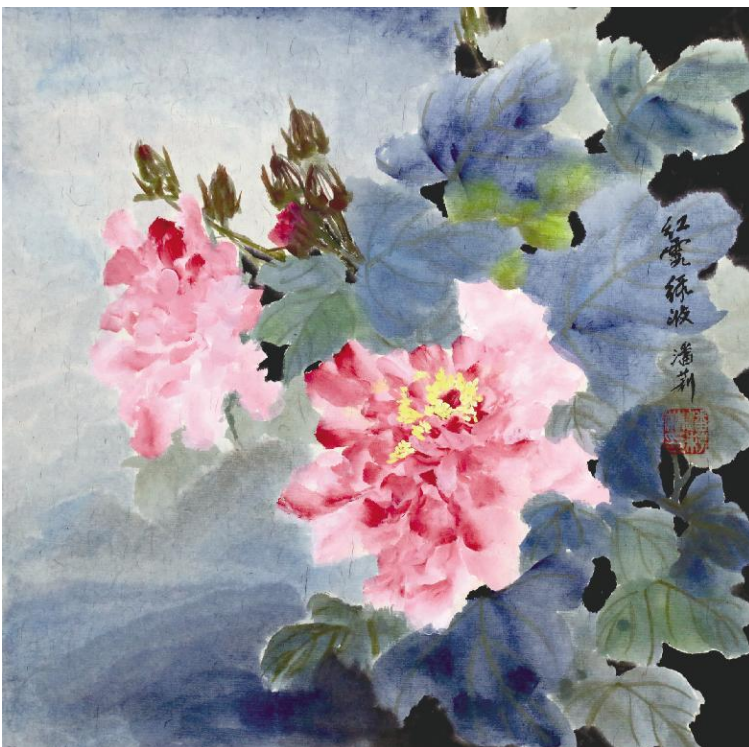
潘莉莉《红露碧波》纸本设色 50cmx50cm 2026年