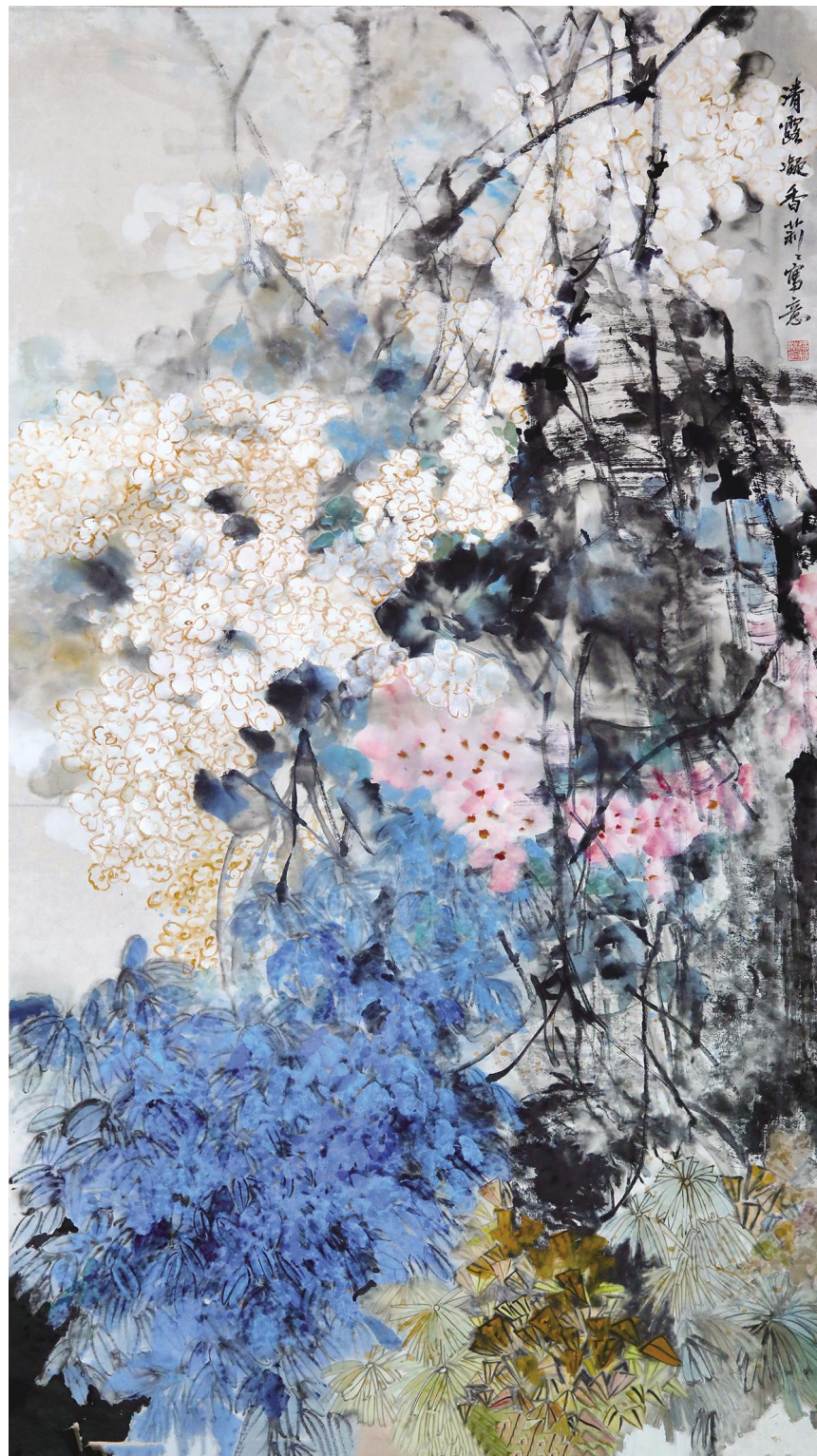
潘莉莉《清露凝香》纸本设色 180cmx97cm 2026年