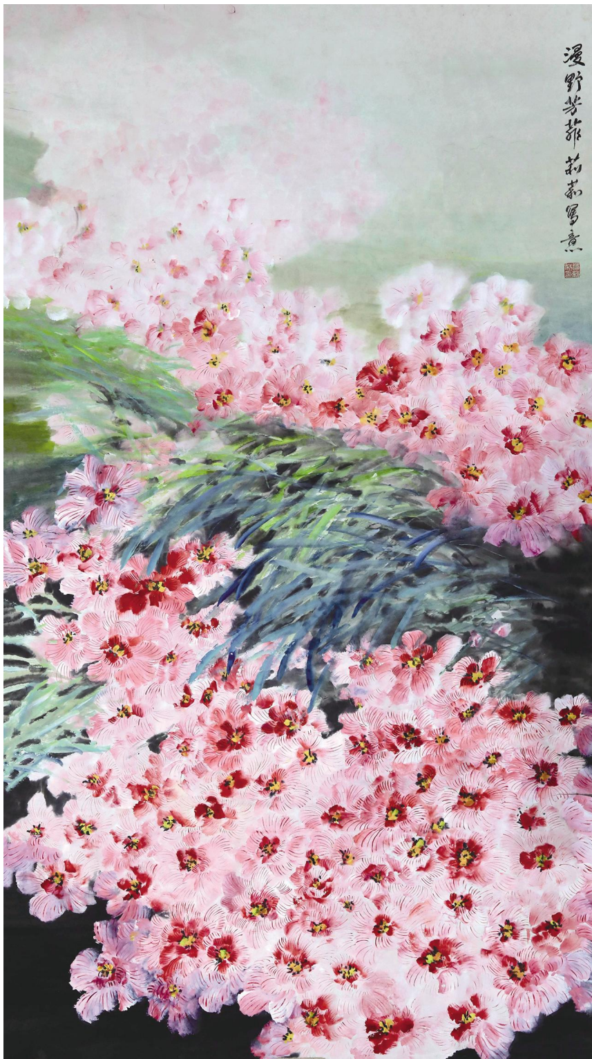
潘莉莉《漫野芳菲》纸本设色 180cmx97cm 2026年

潘莉莉,1985年生,陕西安康人,初中学历。自学国画多年,主攻花鸟画创作,后受教于赵清松、许永明两位老师。作品曾多次入选宁强县书画作品展、汉中市书画作品展、汉中市城固书画联展等展览。