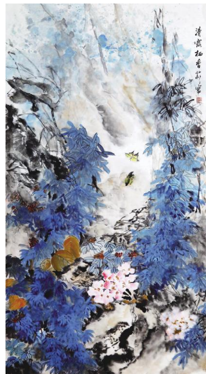
潘莉莉《清露栖香》纸本设色 180cmx97cm 2026年