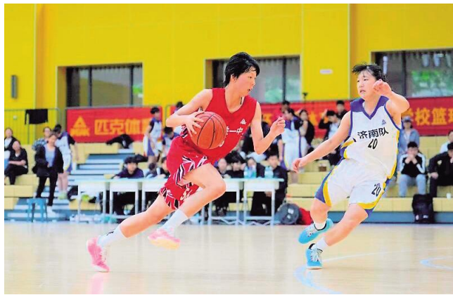
女篮小将们驰骋赛场,尽显竞技风采

文化艺术报讯(全媒体记者 王转)5月5日,2026“铁一陆港”杯全国女篮精英赛落幕。本次赛事聚焦青少年女篮后备人才培养,全国8个省份全国专业体育运动学校、重点中学及16支体育传统项目学校顶尖青少年女篮精英队伍齐聚赛场,以篮球为纽带,展开竞技交流。赛事全程秉持“促交流、共发展”的办赛宗旨,为各参赛队伍备战高中篮球联赛、省级运动会提供了实战练兵的优质契机,也为推动全国校园篮球规范化、专业化发展注入了强劲动力。