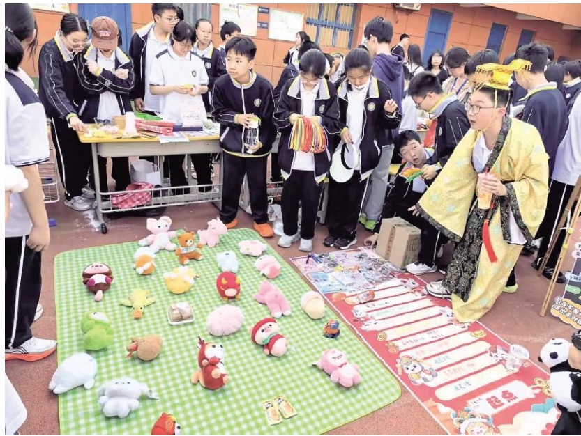
校园淘宝节,同学们化身“小摊主”“小顾客”

4月30日,西安市第六中学教育集团初中部2026年科技节、文化艺术节、校园淘宝节三节联动主题活动举办。活动以多元形式融合育人目标,以趣味载体赋能成长,让学生在丰富多彩的体验中,收获知识、提升素养、锤炼品格,收获快乐。