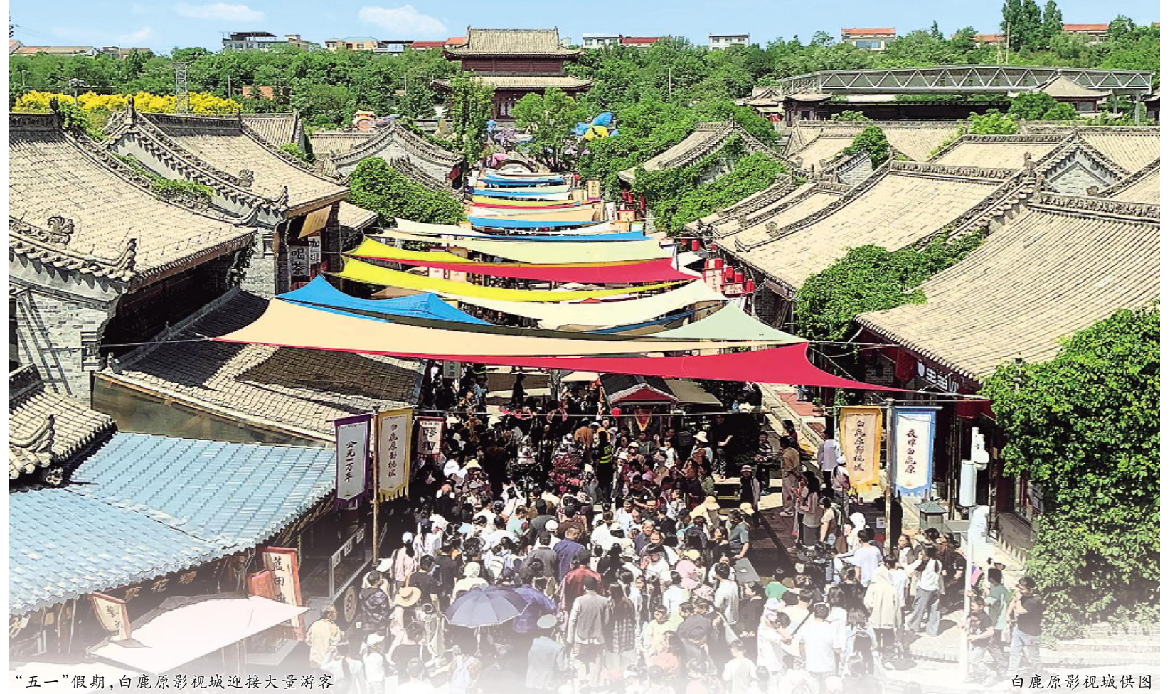
“五一”假期,白鹿原影视城迎接大量游客