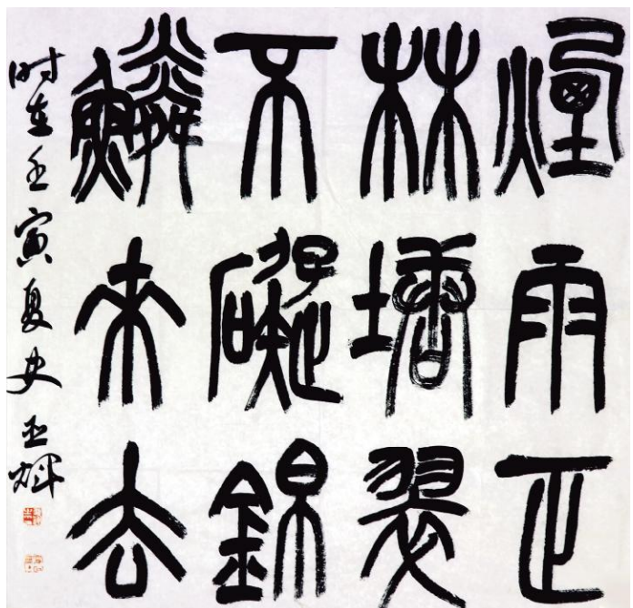
史亚辉《烟雨正林塘》纸本墨书 68cm×68cm 2022年