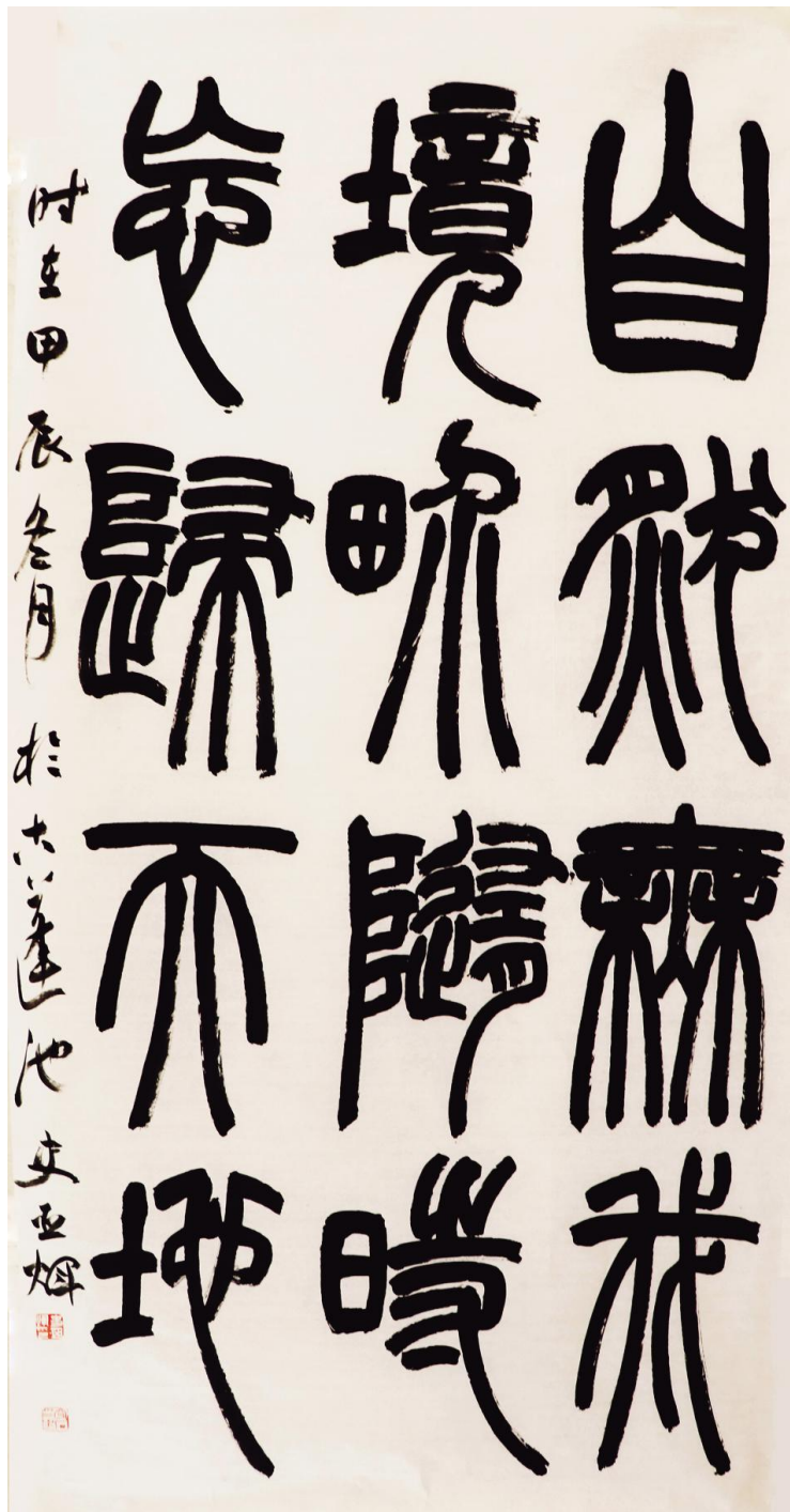
史亚辉《自然无我》纸本墨书 138cm×68cm 2024年