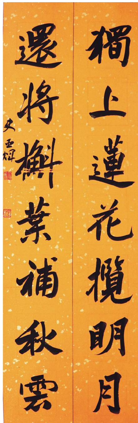
史亚辉《临叶恭卓联》纸本墨书 138cm×34cm×2 2022年