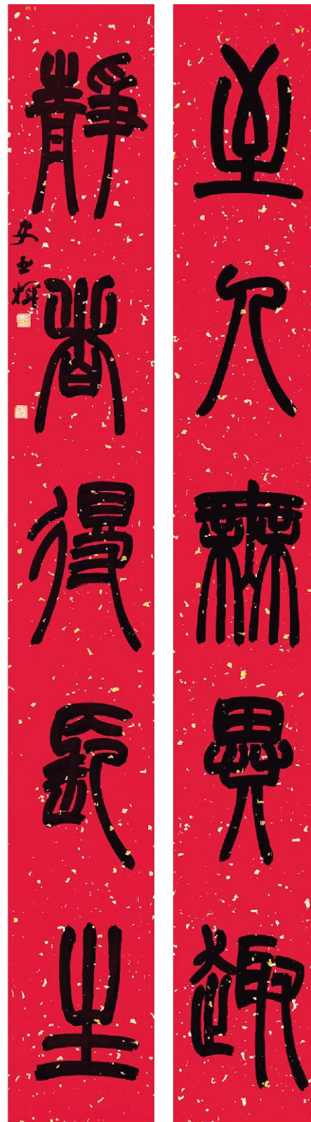
史亚辉《至人静者五言联》纸本墨书 180cm×25cm×2 2024年