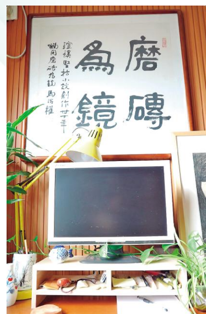
电脑上方的座右铭