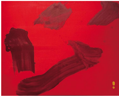
以董 现代书法《止》 丙烯 80cm x 100cm 2025年

1998年生，不二堂门人，东京艺术大学美学研究生在读。曾习建筑，后归于“书”，其创作路径极具当代性，通过丙烯、树脂、矿物颗粒与传统笔墨的碰撞，试图将线条从平面的视觉符号中解构，还原为具有体量感的空间存在。