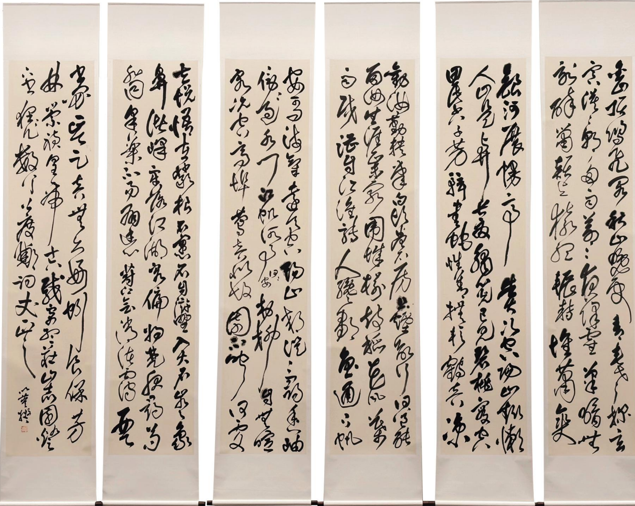
以董《临王铎赠郑公度草书诗卷》 纸本墨书 240cm x 60cm x 6 2024年