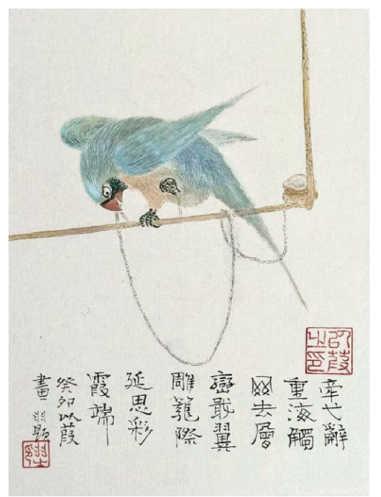
以葭《思霞》纸本设色 18cm x 13cm 2024年