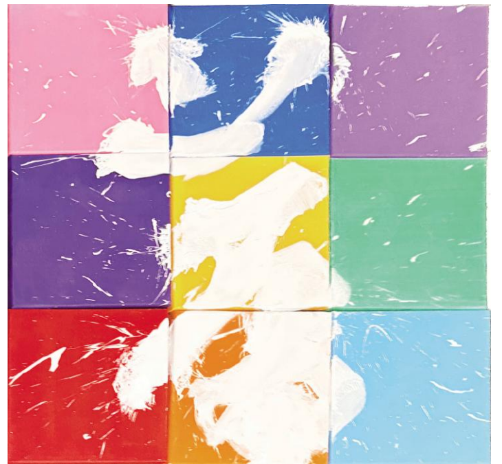
以董 现代书法《梦》 丙烯 90cm x 90cm 2025年