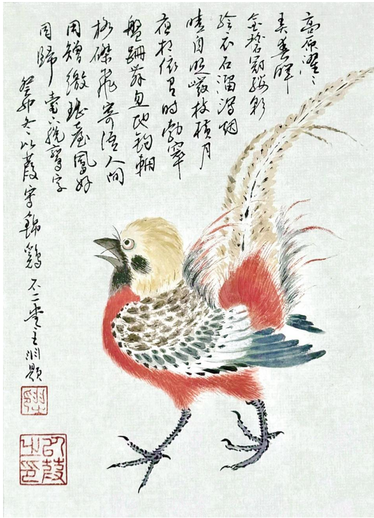
以葭《锦鸡呈祥》纸本设色 18cm x 13cm 2024年