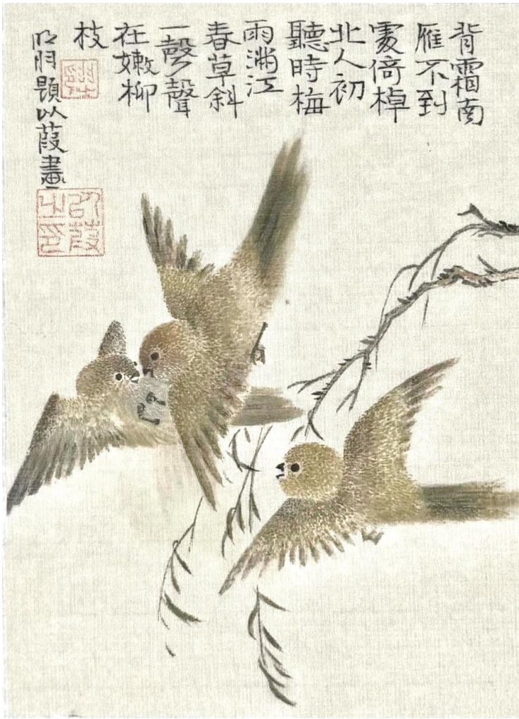
以葭《柳梢春语》纸本设色 18cm x 13cm 2024年

“95后”女生，不二堂门人，眠虹书画研究会会员。她以《道因法师碑》为书学根基，取其瘦硬清劲之风骨，融于画作以为骨法，力求践行“书贵瘦硬方通神”之理。绘画上宗华新罗禽鸟之法，追慕其灵动松活的天趣，规避工巧流俗之弊，于笔墨之外索神采。她深信笔墨当随心，技法为表，心性为里。创作不求繁复，唯以简静之笔、清雅之格，坚守传统正脉，书写自然生机。于传承中探寻属于自己的艺术语言，于寂静处涵养一份从容心境。