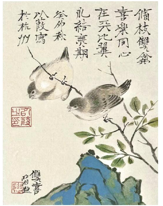
以葭《双喜》纸本设色 18cm x 13cm 2024年