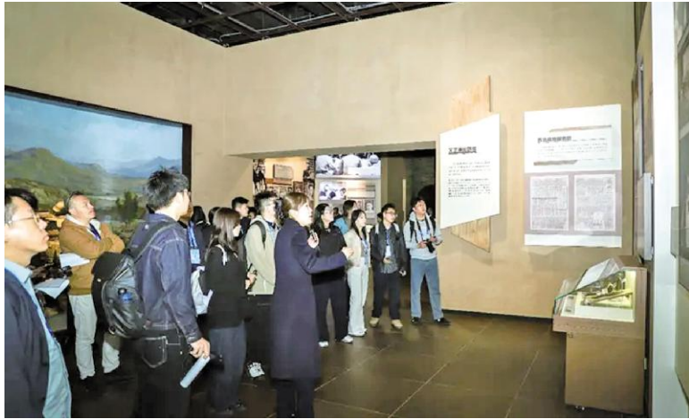
采访团一行参访延安文艺纪念馆

文化艺术报讯(全媒体记者 宇文文波)巍巍宝塔山,见证百年大党的峥嵘岁月;滚滚延河水,流淌跨越时空的文艺长歌。4月5日至6日,“韵润中华 和合同心”——丙午年全国主流网络媒体主题采访团走进延安,先后深入宝塔山、延安文艺纪念馆、冼星海纪念馆与鲁迅艺术学院旧址,在黄土地上用脚步丈量历史,用心灵叩问初心,探寻延安文艺精神在新时代生生不息的精神密码。