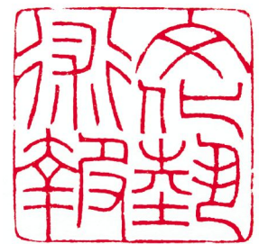
《文化艺术报》 篆刻 / 张哲